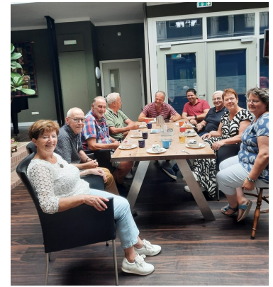
En dan is er tijd voor taart en vlaai!

Na de verzending van Samenhang 100, vorige maand, hebben we met de redactie en andere aanwezigen een klein feestje gebouwd. Iedereen bedankt voor de complimenten en de leuke reacties.