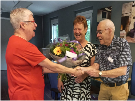
Cilia biedt namens de Werkgroep Nazorg een ruiker bloemen aan.